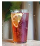
Coffee Cherry Tonic